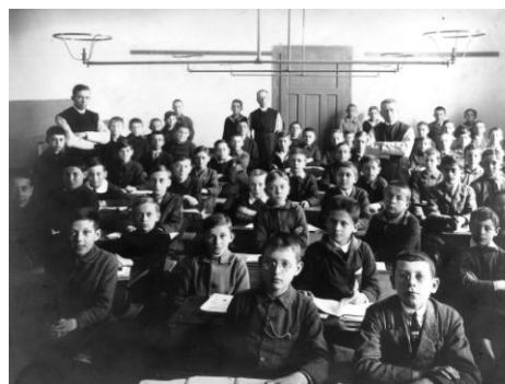
Váli utcai osztálykép