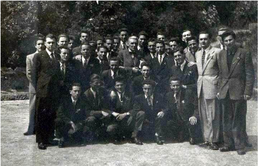
ITT MÉG EGYÜTT VOLTUNK . . .