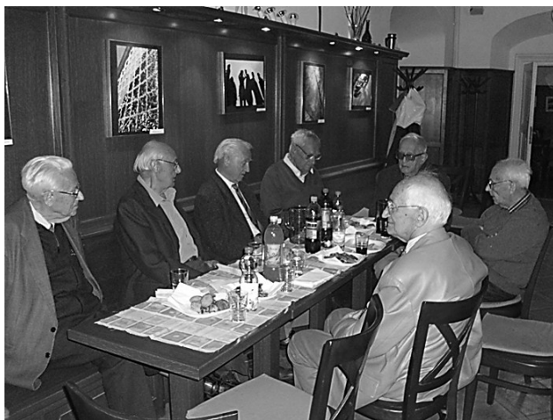
Fogyóban az osztálylétszám

a '45-ben érettségizett A és B osztály gondviselője